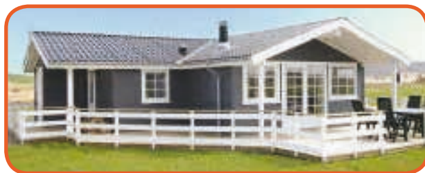
Huset i Bork