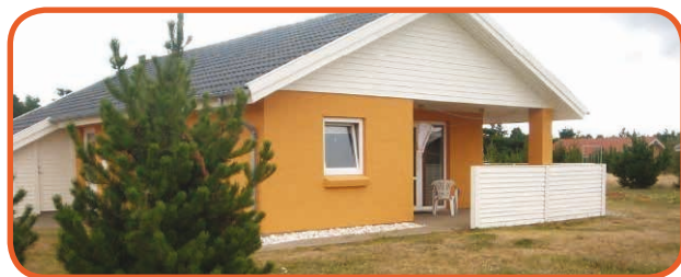
Huset i Houstrup

Ansøgere med skolesøgende børn kommer i første "lodtrækningsrunde" for de uger som dækker skoleferierne. Vi sørger for at alle ansøgere vil få besked så hurtigt som muligt efter den 15. januar, uanset om de har fået huset eller ej. Ledige perioder udlejes derefter efter først til mølle princippet.