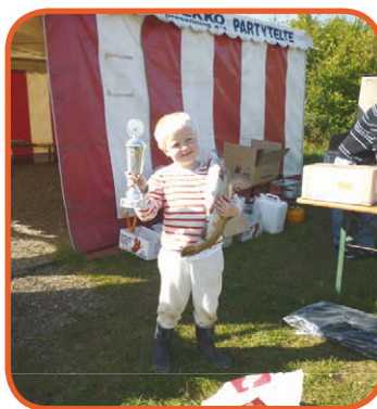
P.v.a. aktivitetsudvalget - Anker

Alt i alt en rigtig god dag hvor snakken gik lystigt blandt kollegaerne. Jeg håber at se alle deltagerne og gerne flere til næste år.