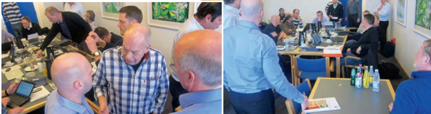
Billeder fra forhandlingerne i 2012.