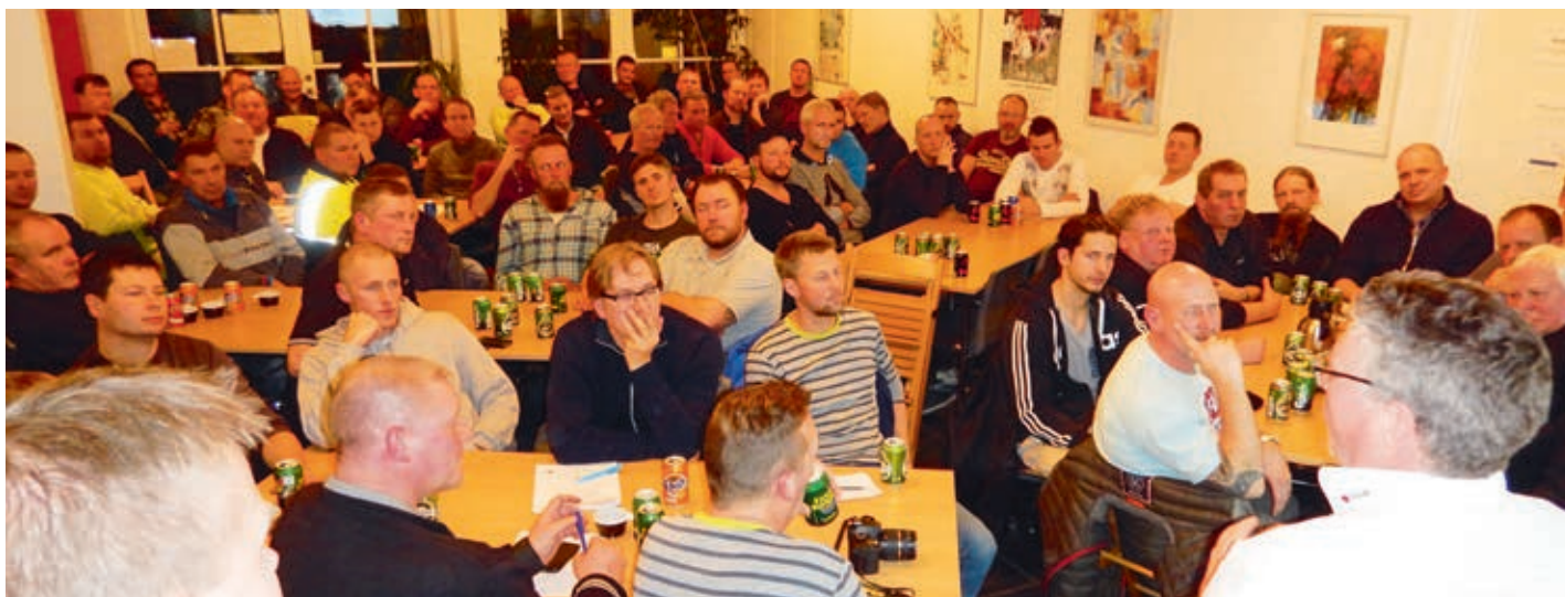
Fra mødet 2015 i Roskilde.

Med venlig hilsen Kreds Sjælland - Bornholm