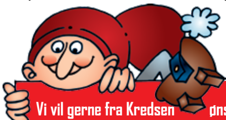
Niels Braaby Kredsformand

Der er igen tvivl om, at kampen mod social dumping og billig udenlandsk arbejdskraft bliver et hovedkrav fra alle byggeforbundene i 2017.