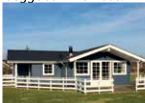
Huset i Bork