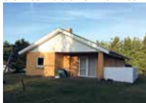
Huset i Houstrup

Bemærk: der er nu Internet i begge sommerhuse.