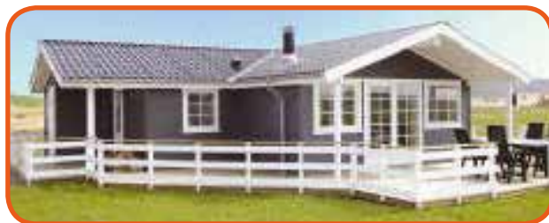
Huset i Bork