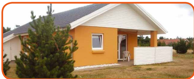
Huset i Houstrup

Der er skiftedag fredag kl. 16.00. Weekend kan kun lejes hvis huset ikke er lejet ud i hele ugen.