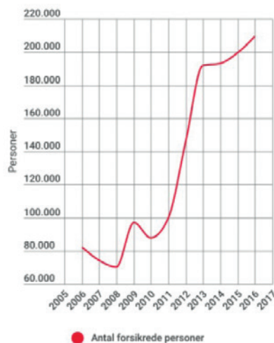
Antal personer med privat lønforsikring

Kilde: Danmarks Statistik og De Økonomiske Råd (DØRS)