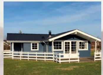
Huset i Bork