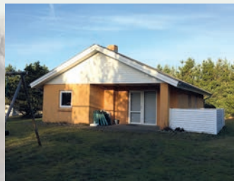
Huset i Houstrup