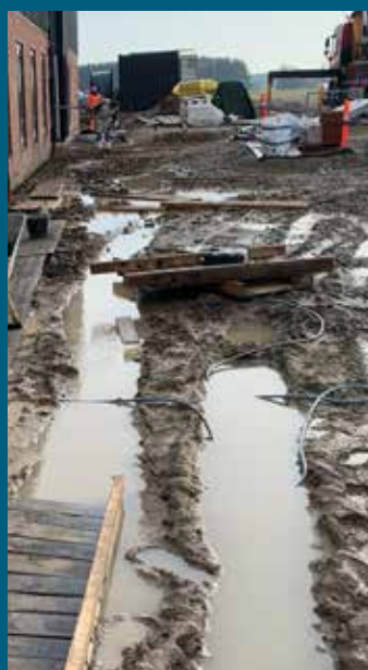
Plads i Ringsted hvor Ribe VVS går. Som det andet billede, mangler der respekt for de stakels medarbejdere, som udfører arbejde på denne plads. Ledning i vandet, rod og dårlige adgangsforhold.