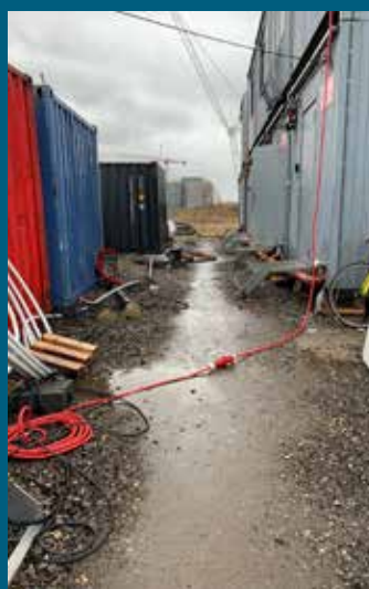
Ørestaden hvor Star VVS arbejder. Her kan det undre, at man ikke har hængt forsyningen af el til skurbyen op, da der var rig mulighed for det. Igen ser vi en byggeplads hvor oprydningen ikke har fokus, til fare for vores kollegaer, der kan ende med en lang sygdomsperiode ved at falde en mørk morgen.