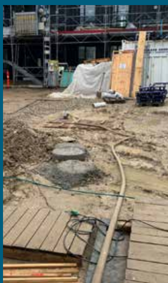
Plads i Ringsted hvor Ribe VVS går. Billederne viser tydeligt en plads, hvor det roder til fare for vores kollegaer. Man kan tvivle på kvalitet af det der afleveres, når det er færdigt til beboerne. Byggepladspatroljen har besøgt pladsen flere gange og kommer tilbage.