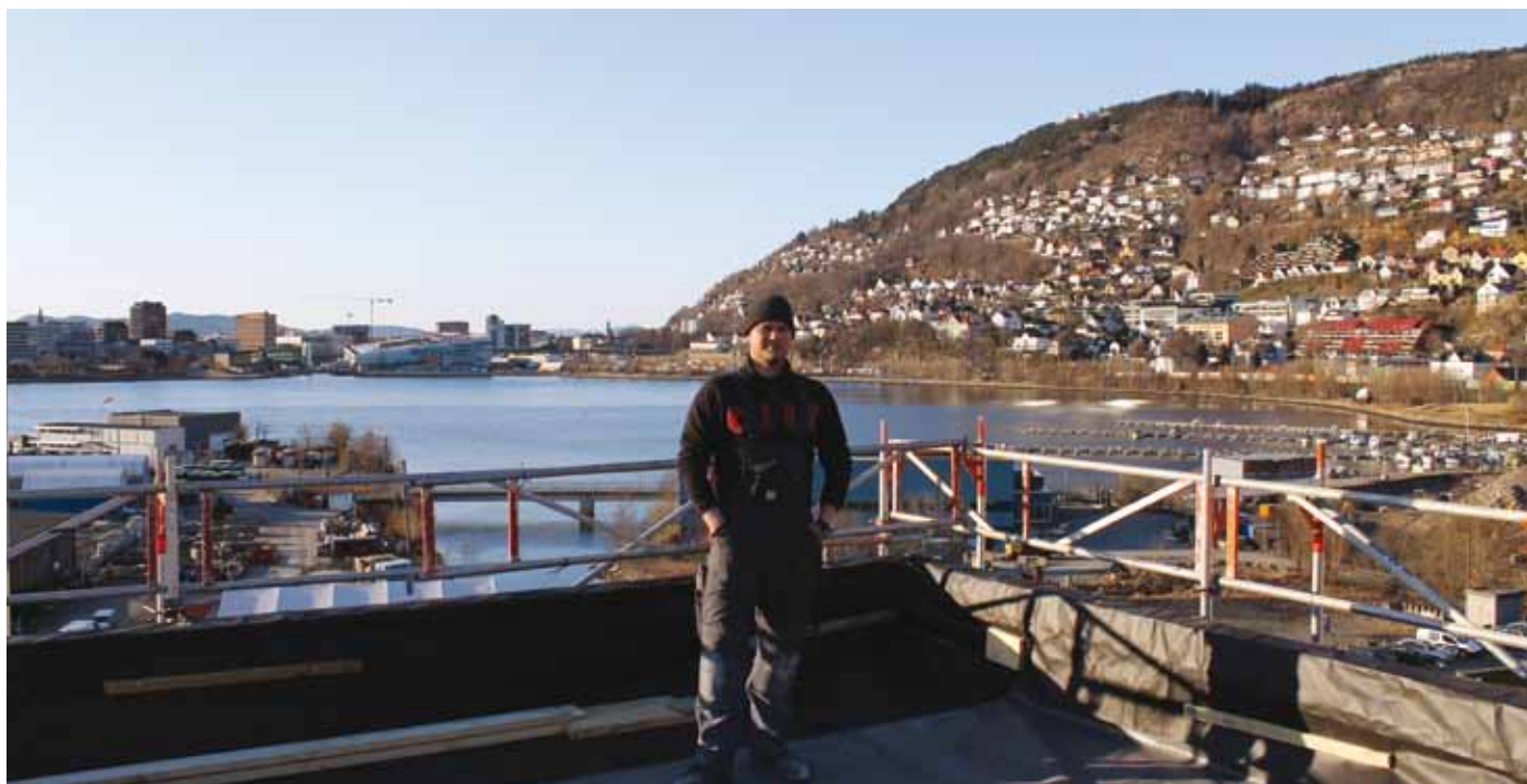
Christian i Bergen