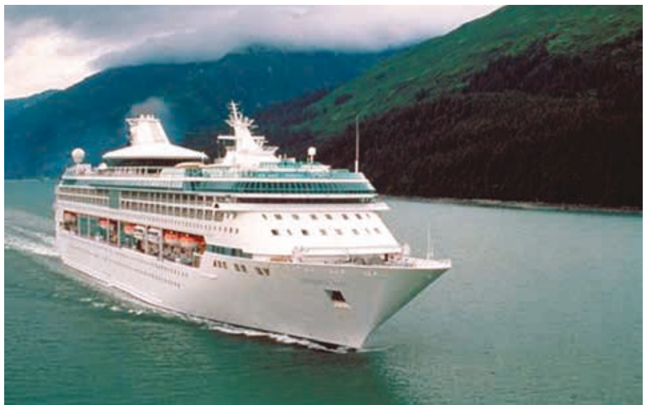
Legend of the Seas fra rederiet Royal Caribbean Cruise Line med en total kapacitet på 2436 passagerer og 742 besætningsmedlemmer får æren af at indvi Københavns nye krydstogtskibskaj. Den anløber 2. maj kl. 07.00 og tager af sted igen kl. 17.00 samme dag.

poly-etylen rør i en så stor dimension som 560 mm, hvilket giver et lavt trykfald og dermed en hurtigere fremføring end tilfældet ville være med en mindre rørdimension, selv om trykkoten i vandledningen til krydstogtskibskajen er den normale for København, nemlig 40 meter vandsøjle,” forklarer civilingeniør Andreas Christiansen.