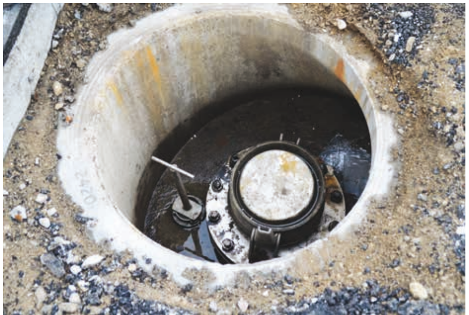
Her slutter ledningen: Et af flere vandudtag på de store bådes kaj.

”Opgaven har bestået i at få store mængder vand fra et punkt til et andet i løbet af kort tid. Den udfordring er teknisk set løst ved, at der er anvendt