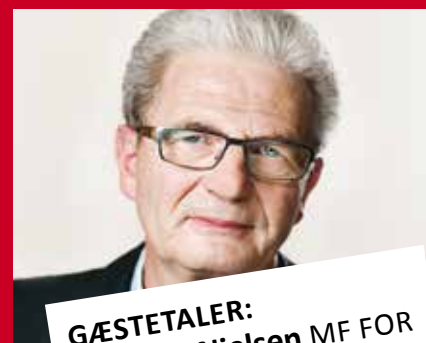
GÆSTETALER: Holger K Nielsen MF FOR SOCIALISTISK FOLKEPARTI