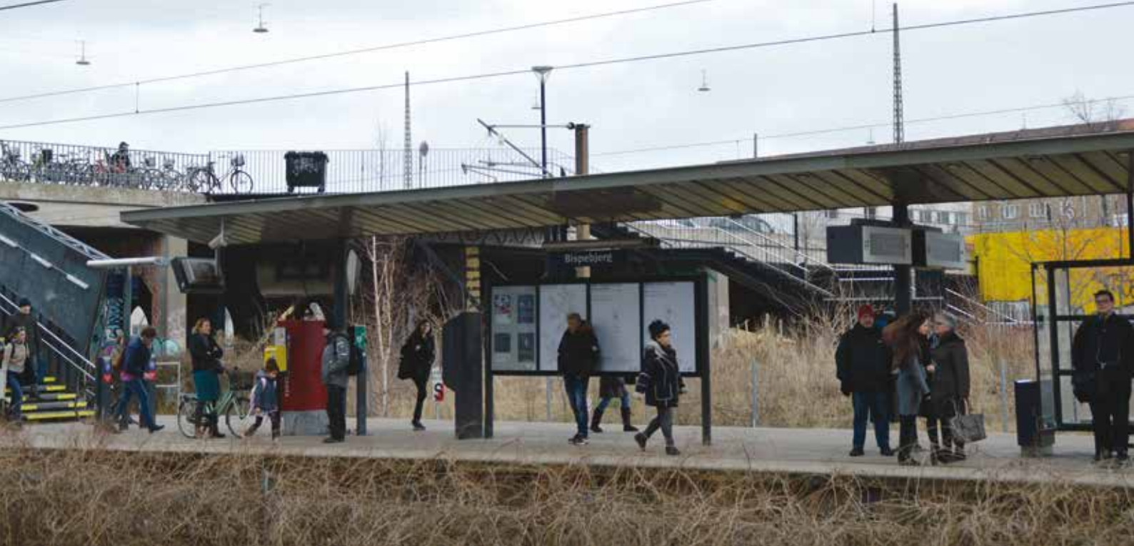
Bispebjerg Station på ydersiden af ringbanen, et veludført spydkast fra Byggefagenes Hus på Lygten. På modsatte side anes gul p-zone.