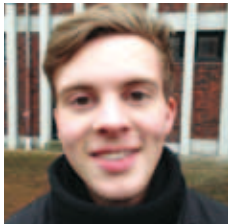
Lasse Ibsen Søren Frederiksen A/S