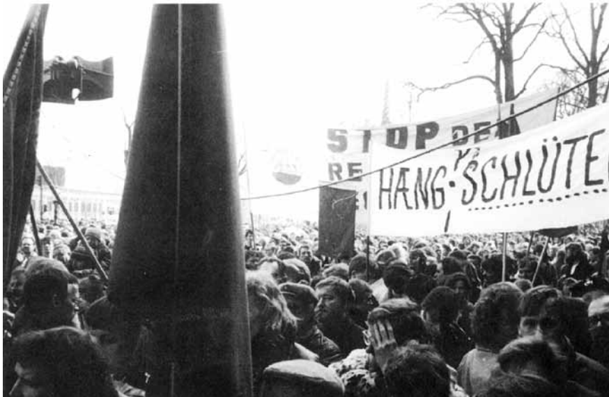
Fra demonstrationen i 1985 mod regeringsindgrebet i overenskomstforhandlingerne.

80'erne var de borgerlige regeringers årti. Der var fire af slagsen i perioden 1982-1993, alle ledet af Poul Schlüter og med dagsordener, der til forveksling lignede den, som vores nuværende regering går frem efter. Også dengang handlede det om dagpengeforringelser, om sociale nedskæringer og om, at almindelige mennesker måtte kunne forstå, at krisen krævede løntilbageholdenhed fra deres side.