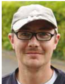
Morten Møller Larsen Henriksen og Jørgensen A/S