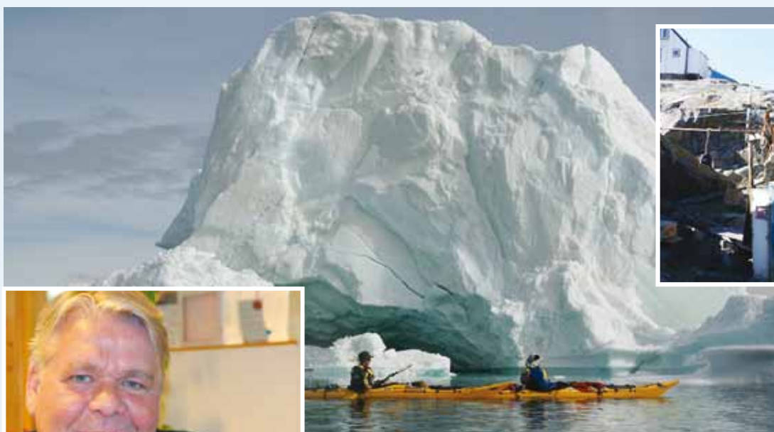
Uummannaq er en typisk fangerby