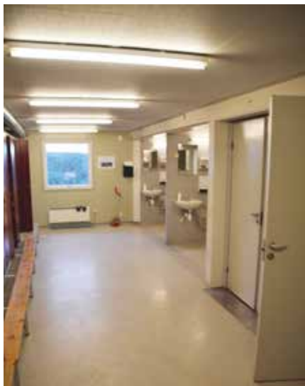
Fælles bad og toilet.

Bravida-sjakket på. Rengøringen lod meget tilbage at ønske, både i grundighed og hyppighed, mente man.