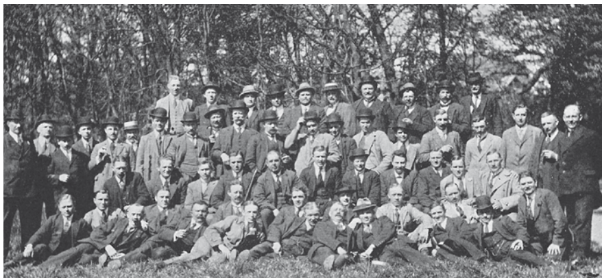
Rørlægger-skovtur under lockouten 1921.

Rørlæggernes Fagforening havde de første år af sin eksistens et så heftigt forbrug af formænd, at man var ude i noget misbrugsagtigt.