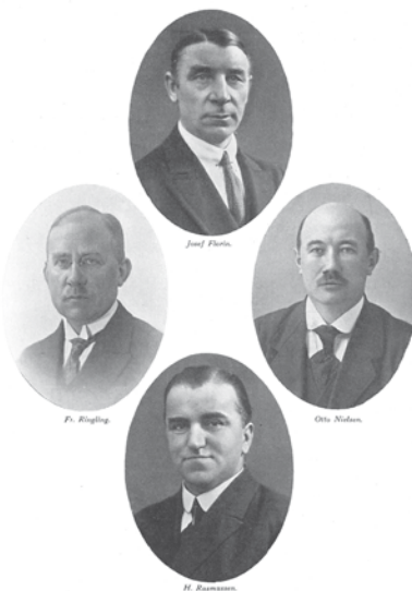
Rørlæggernes Fagforenings fire første formænd.