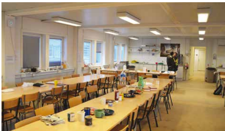
Kantinen, som er en spisesal uden betjening og vareudsalg.

bygge- og anlægsarbejde skal være. Her er aflåselige toiletter i fornødent omfang, spiserum med borde og siddepladser