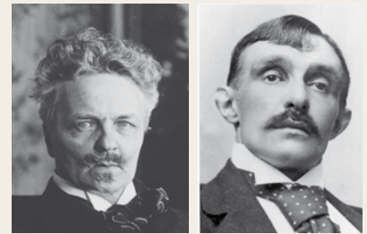
Forfatterne August Strindberg og Herman Bang dør