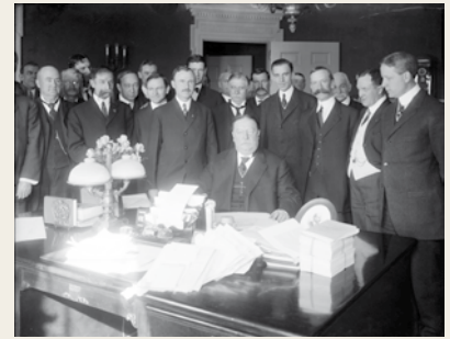
Arizona bliver optaget som USA's 48. stat