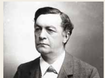
Klaus Berntsen fra Venstre er statsminister