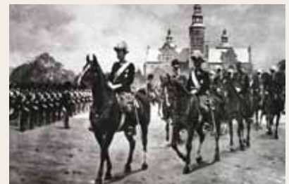
Christian den 10. bliver konge