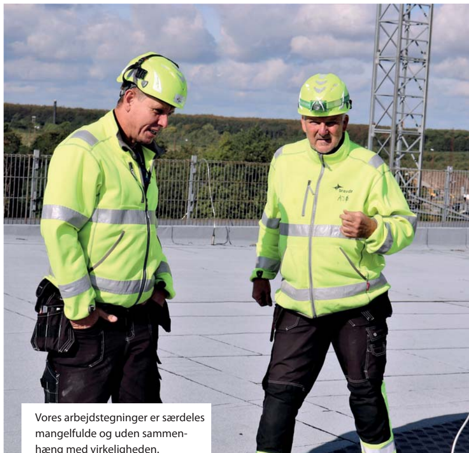
Vores arbejdstegninger er særdeles mangelfulde og uden sammenhæng med virkeligheden.

De to håndværkere har valgt at råbe op nu, da bygningsarbejderne ofte får skylden for at arbejde for langsomt, kvalite-