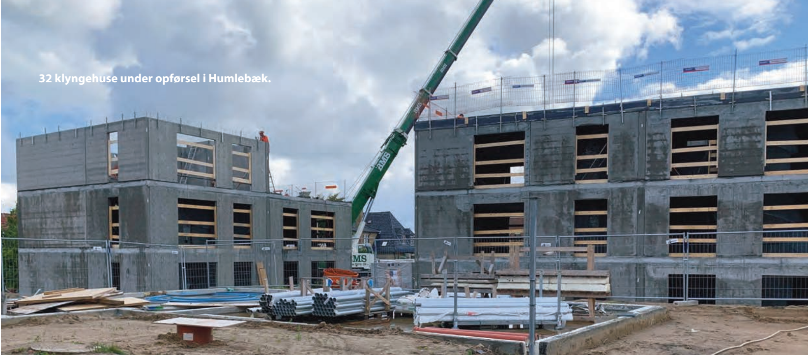
32 klyngehuse under opførsel i Humlebæk.