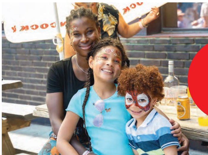
Ansigtsmaling til alle aldre