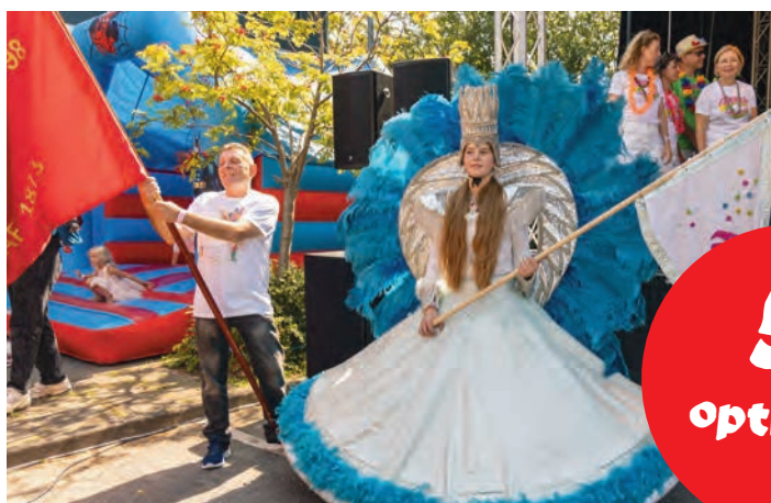
Pladsen blev væltet af A Bandas festlig indmarch med Rør & Bliks fane forrest