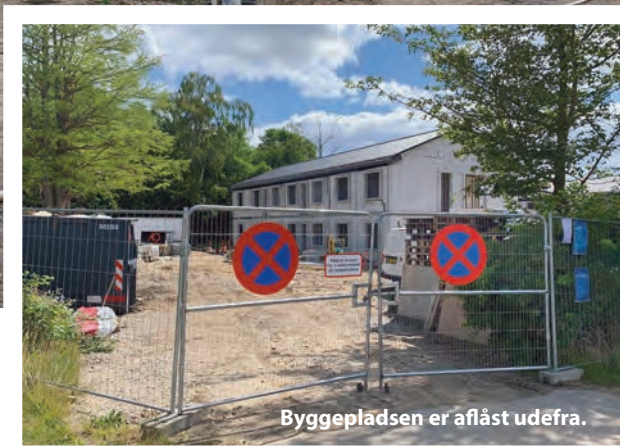
Byggepladsen er aflåst udefra.

for bøder på 3.000 kroner og blev så hurtigt udvist fra Danmark.