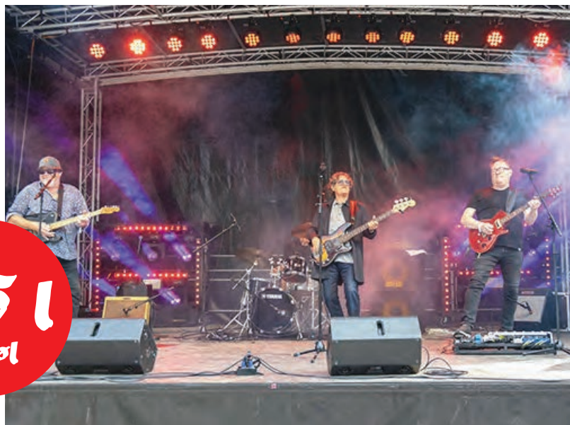
SPONFUN fulgte op med folkelige rockklassikere med Helmigs, Shu-bi-duas og Kim Larsens evige evergreens.