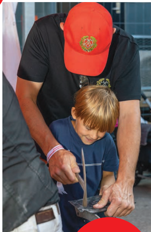
Det arbejden- de værksted fra TEC Glad- saxe tiltrækker nye lærlinge