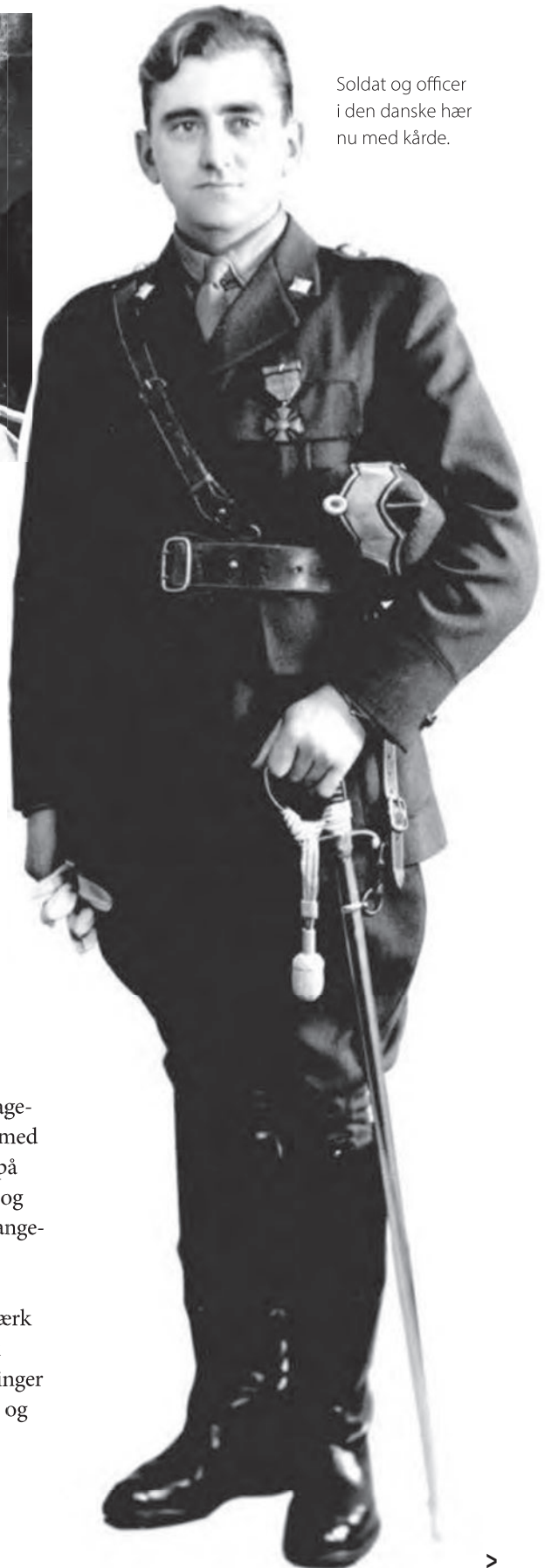
Soldat og officer i den danske hær nu med kårde.