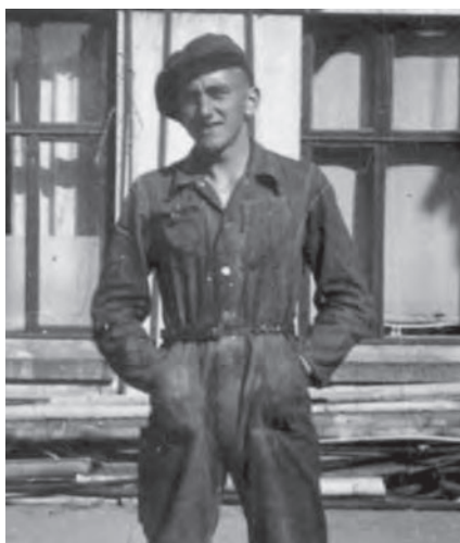
Stolt blikkenslager i Herning 1937.