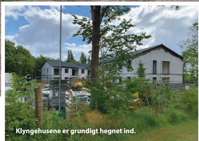
Klyngehusene er grundigt heget ind.