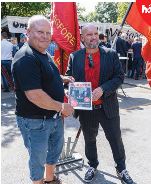
Rør & Blik på forsiden af Blik & Rør.