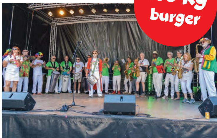
Temperaturen på festivalen steg til tropehøjder med svedig gadesamba til stor jubel og bifald